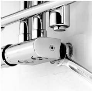
Dokręcamy zawór do instalacji