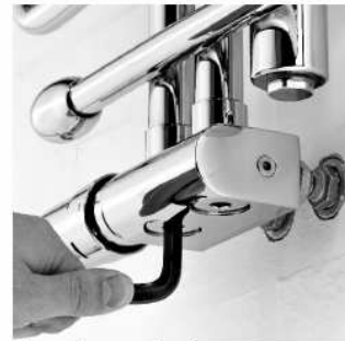
Dokręcamy zawór do grzejnika